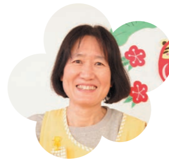
園長からのひとこと

新卒保育士の時から先輩保育士の動きをよく見てよく聞いてよく考えて動くことのできる先生です。3年目で一人担任としてしっかりと子どもの目線に立って温かな保育を展開しています。1年目から悩みのない先生は、誰もいません。悩みながらも、先輩保育士の背中を追いかけて、自分の中で取捨選択して自分なりの保育を見つけて自ら楽しいと思える保育を体現している保育士の一人です。