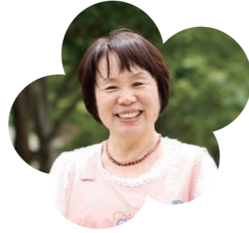
園長からのひとこと

主任は、園長と共に保育園を運営していきます。園長と共通認識の元、より園の現場に近いところで、子どもたちと保護者、そして職員と関わりながら、課題を解決して園をよりよくするのは、私が園で大切にしているのは「和」。主任は、それを笑顔で実現してくれます。彼女の笑顔でみんなの心がまとまっています。力強い、頼りになるパートナーですね。