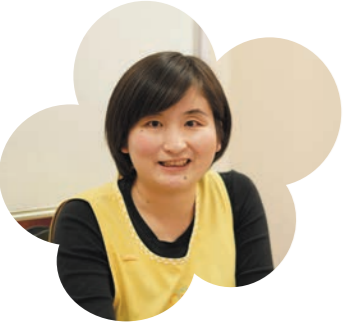
後輩からのひとこと

先生が演奏を始めると、子どもたちの表情がぱあっと明るくなるんです。先生も子どもたちも、とっても楽しそう。音楽の力もそうですが、どんなときも前向きで積極的な先生の性格も大きいと思います。私もそのポジティブさに、行事の準備中などはいつもカブけてもらっています。私も自分の得意分野を保育に活かしてがんばりたいな、と思っています。